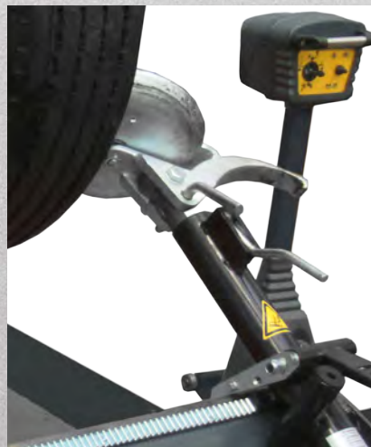
DISQUE ET BEC DE DÉTALONNAGE